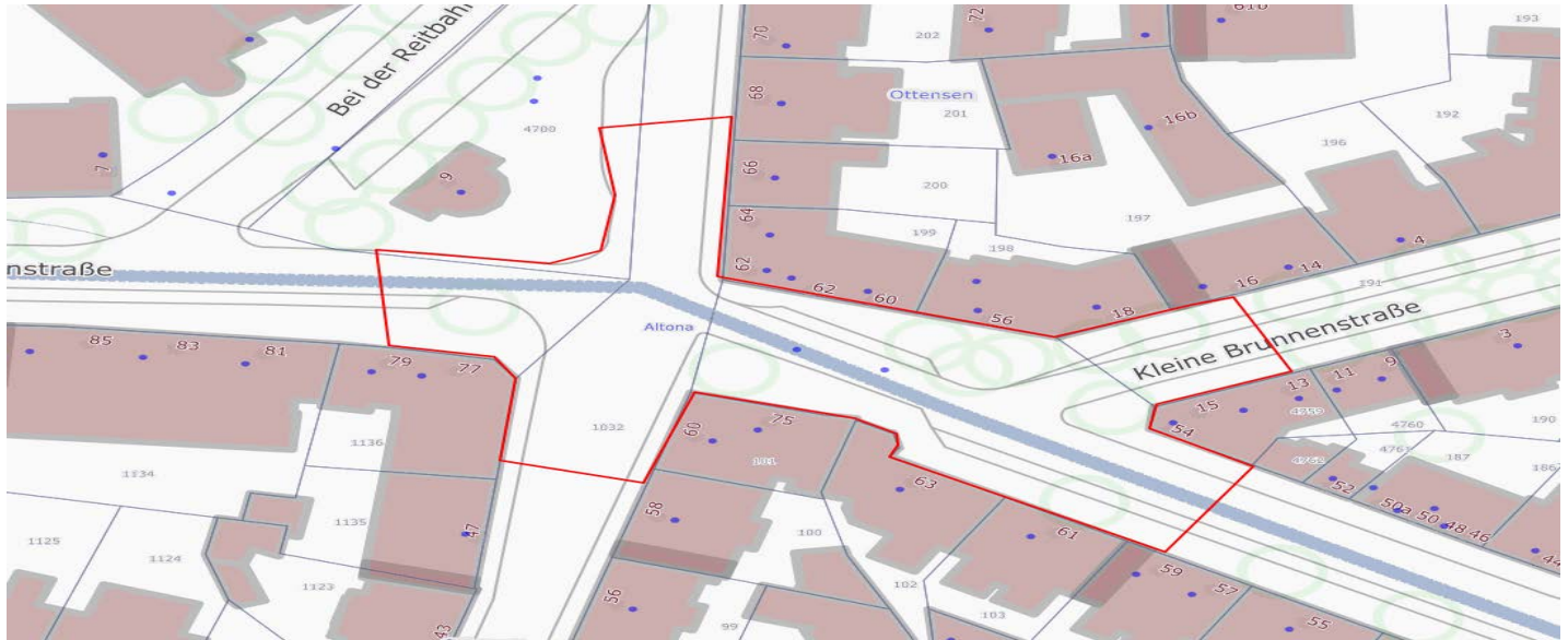
Abbildung 1 Eulenstraße