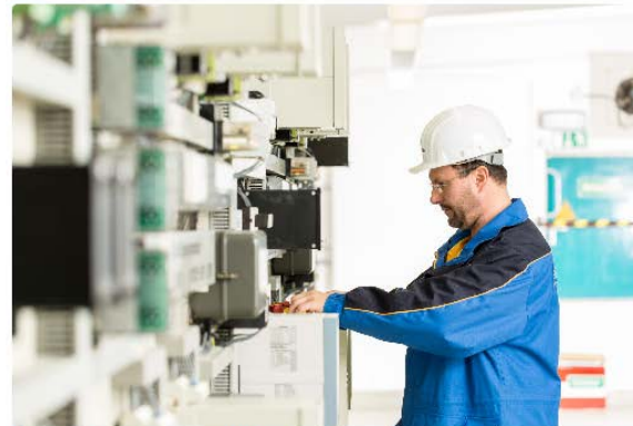
Inbetriebsetzung von Anlagen

Um Ihnen eine schnelle Bearbeitung gewährleisten zu können, ist es wichtig, dass Sie unseren Ablaufplan zum Anschluss und zur Inbetriebsetzung Ihrer Anlage Schritt für Schritt folgen.