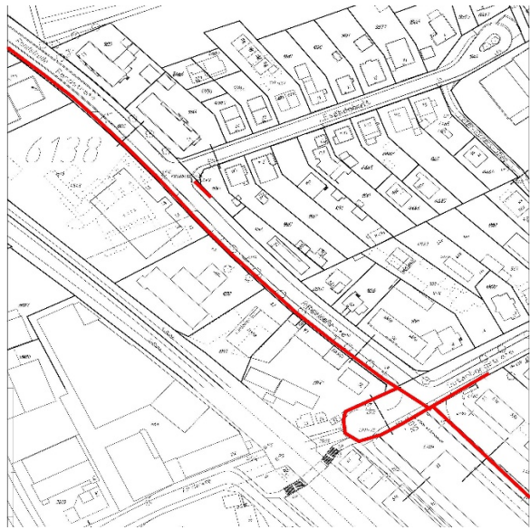
Randstraße und Gutenbergstraße